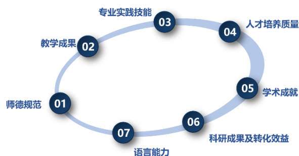
图2 “七维度”评价指标体系考核机制

“七维度”评价指标体系考核机制（图2）应用到教师的关键业绩、能力评价考核。建立学生、校内外专家、实践单位等多元评价运行体系。